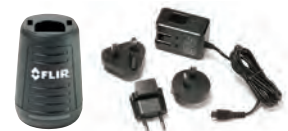
充電器 (ACアダプタ付) ¥32,000