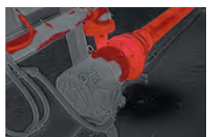
閾値設定機能 カラーアラーム機能