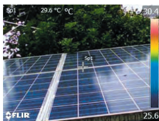
デジタルカメラモード

MSX ® 機能(スーパーファインコントラスト機能)は、リアルタイムで画像を補正することができ、構造物の詳細や発熱箇所の判別が熱画像上で容易に行えます。また、デジタルカメラモードとの同時撮影も可能で、同画角の可視画像を簡単に生成することができます。