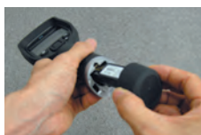
リプレーサブルバッテリー