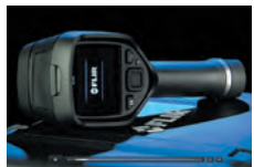
国内フルメンテナンス