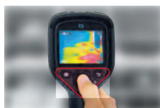
片手で全ての操作が可能